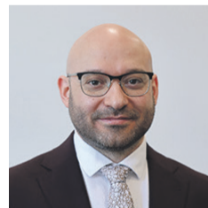
MINISTER FÜR ARBEIT UND SOZIALES