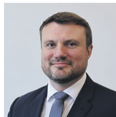
MINISTER DER FINANZEN

Kathrin Schneider (1962 in Lübben), Diplom- Agraringenieurin (1986), Referatsleiterin (ab 2002), Staatssekretärin im Ministerium für Infrastruktur und Landwirtschaft (2013), Ministerin für Infrastruktur und Landesplanung (2014-2019)