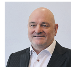
MINISTER FÜR INFRASTRUKTUR

Dr. Benjamin Grimm (1984 in Jerusalem/Israel), Rechtsanwalt (2013-2019), Staatssekretär und Beauftragter für Medien und Digitalisierung (2019-2024), Landtagsabgeordneter (seit 2024), Minister MdJD (seit 2024)