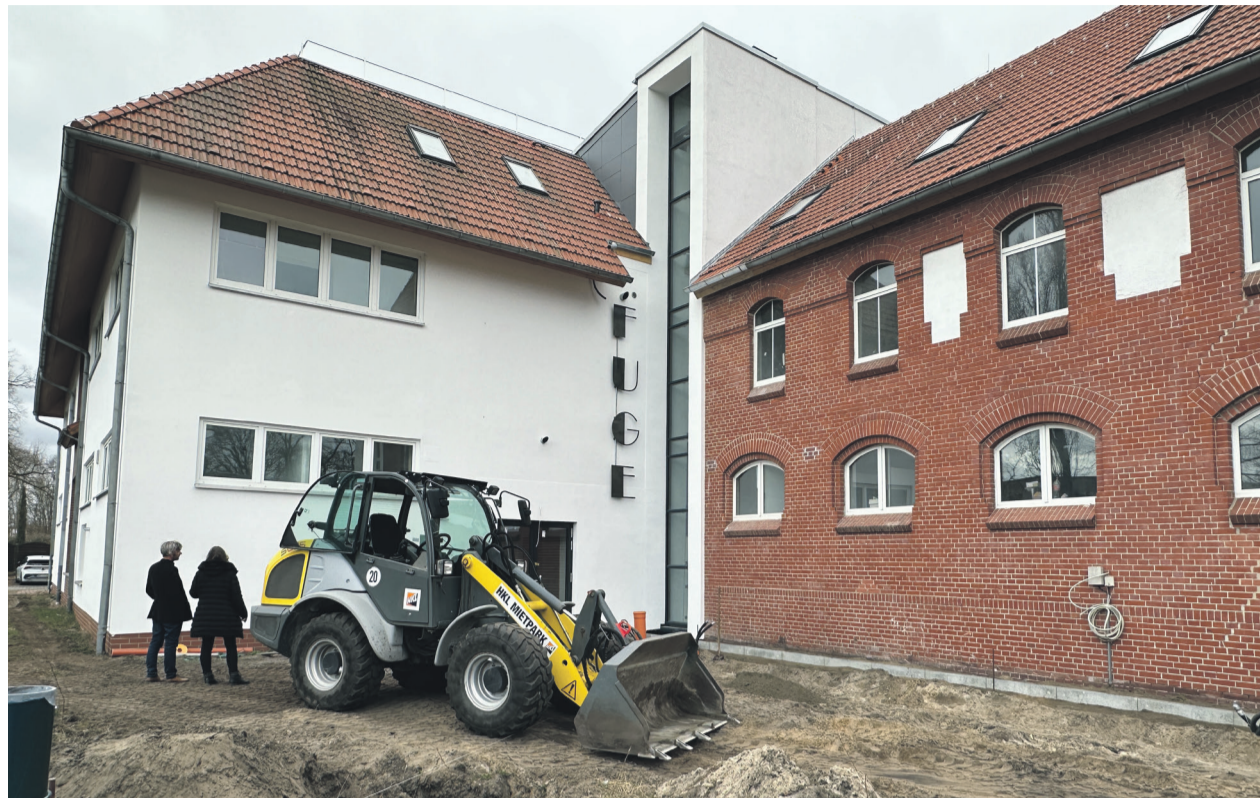
Nach nur einem Jahr Bauzeit hat die KulturFUGE im September 2025 eröffnet