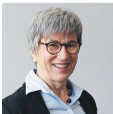
CHEFIN DER STAATSKANZLEI

Dr. Dietmar Woidke (1961 in Naundorf), Landwirt, promovierter Diplomagraringenieur, Minister für ländliche Entwicklung (2004-2009), Innenminister (2010-2013), Ministerpräsident seit 2013