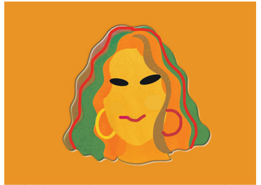
Workshopreihe: Frauen und Finanzen

Was ist also zu tun? Es gibt ein großes Angebot an Aus- und Fortbildungen, die wir alle buchen können: Finanzbildung online. Für manche ist das ein sehr guter