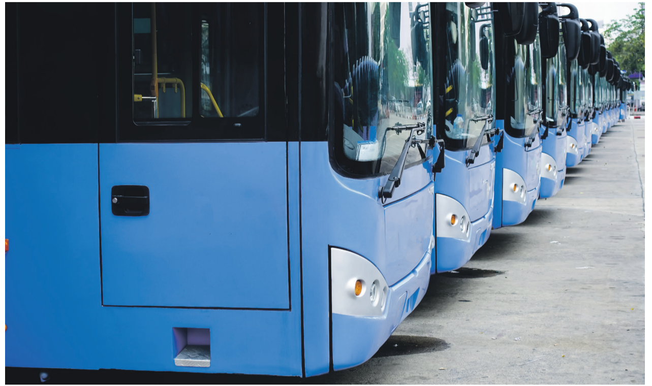
Das Schülerticket bleibt erhalten

Vor diesem Hintergrund unterstützt die SPD-Kreistagsfraktion die neue