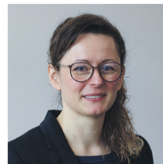
MINISTERIN FÜR LANDWIRTSCHAFT