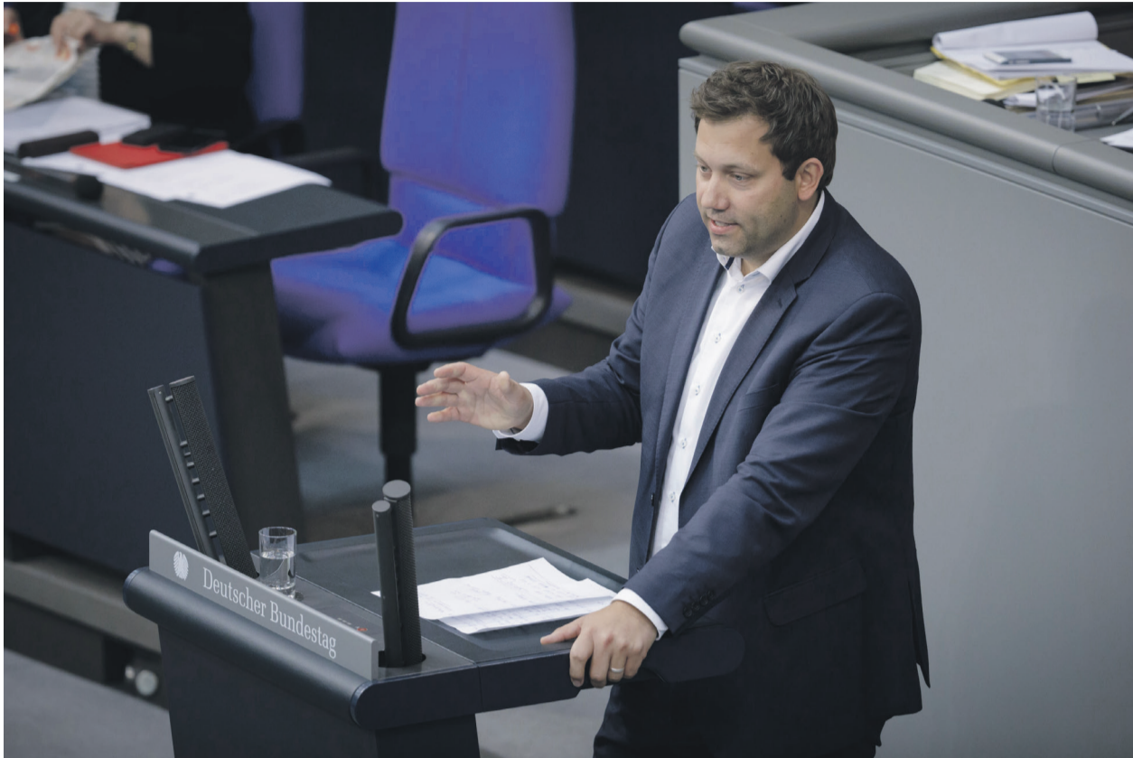
Lars Klingbeil, Vizekanzler und Finanzminister

Gleichzeitig verbindet Klingbeil seinen Reformkurs mit einer Modernisierung des Arbeitsmarktes. Angesichts des