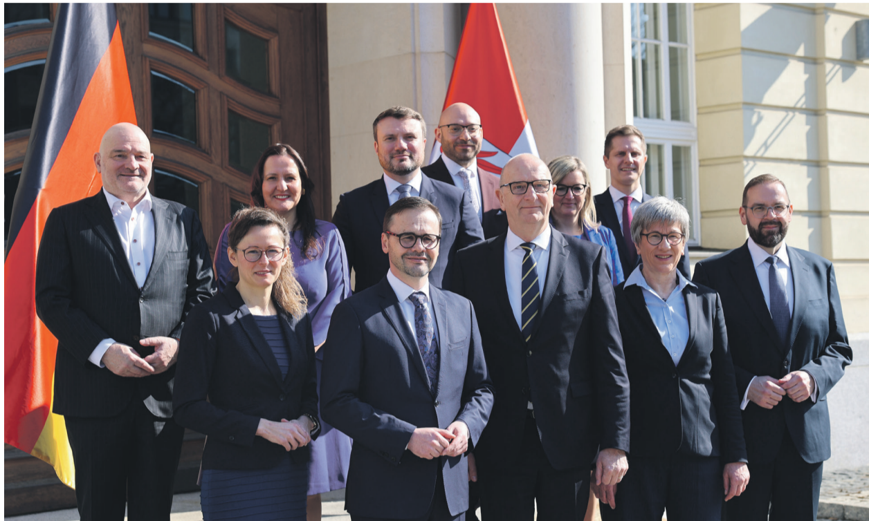
Ministerpräsident Dr. Dietmar Woidke mit seinem neuen Kabinett